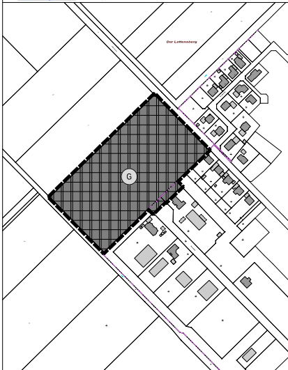
Maßstab: 1 : 2.500