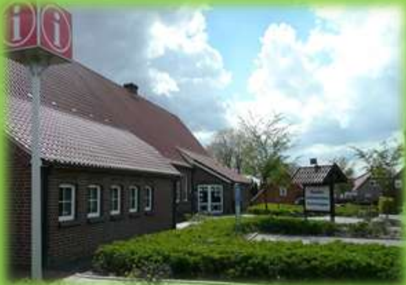
Kath. Kirche u. Altes Herrenhaus